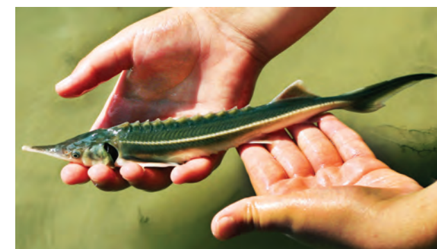
1. ábra. Mesterséges szaporításból származó kecsgeivadék kihelyezés előtt

A Kárpát-medence nagyobb folyóiban állományai jelentősek, a kisebb folyókban csak alkalmilag jelenik meg. Előfordulása ismert: a Duna és a Dráva teljes hazai szakaszán, a Mosoni-Dunában, a Rába és az Ipoly alsó szakaszán, a Murában, a Tisza teljes hazai szakaszán, a Szamosban, a Bodrogban, a Hármaskörösön, a Kettőskörösön és a Sebes-Körösön, a Berettyóban és a Marosban (HARKA és SALLAI 2004).