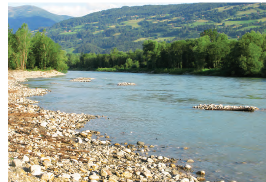
2. ábra. Márnazóna a Dráván

A kecsge folyami hal, amely a nagy folyók síkvidéki tájéka ( potamális régió ) teljes szakaszán megtalálható, azaz a viszonylag gyors folyású, többszörösen szétágazó, zátonyos medrű és kavicsos aljzatú márna szinttájtól ( 2. ábra ) a kisebb esésű, lassabban áramló, meanderező dévér szinttájig ( 3. ábra ). Kis rajokban csoportosulva általában a folyómeder mélyebb területeinek gödreiben tartózik.