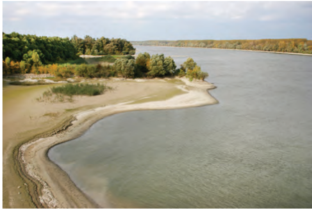
3. ábra. A Duna dévérzónája

codik, sziklás, kavicsos, homokos vagy kemény, agyagos aljzaton. A folyó áradásakor az elöntött ártereken keres táplálékot. A fiatal példányok életük első nyarán néha a sekély, homokos aljzatú mederrészekre tömörülnek. A víztározókban többnyire a felső szakaszon fordul elő, ahol a hidraulikai paraméterek kevésbé térnek el a nem duzzasztott folyómederre jellemző viszonyoktól. Tavakban igen ritkán bukkan fel. Például a nagyobb dunai árvizek idején egy-egy példány a Fertőbe is eljutott (FALUDI 1973).